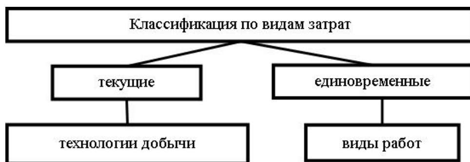
Рис. 3. Предлагаемая классификация методов увеличения нефтеотдачи

- гидродинамические методы – методы увеличения коэффициента охвата малопроницаемых нефтенасыщенных объемов пласта вытесняющей водой путем оптимизации режимов нагнетания и отбора жидкости при заданной сетке скважин и порядке их ввода в работу; методы представляют собой дальнейшую оптимизацию технологии процесса заводнения и, поэтому, не требуют существенного её изменения;