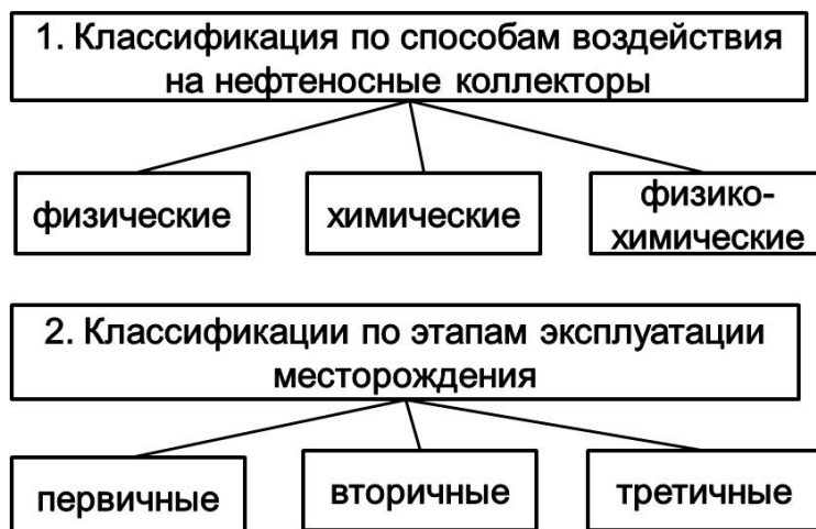
Рис. 1. Существующие классификации методов увеличения нефтеотдачи

разрабатываемых участках (особенно в литологически неоднородных зонах нефтеносных пластов с трудноизвлекаемыми запасами) опережает выработку запасов при существующей плотности сетки скважин. Увеличение нефтеотдачи происходит за счет обеспечения большей площади контакта продуктивного пласта со стволом скважины (рис. 2).