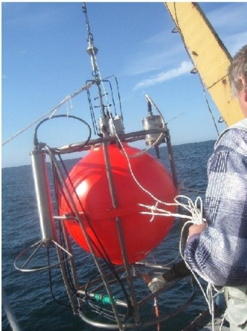
Рис. 2. Внешний вид обсерватории ОКБ ОТ РАН (во время натуральных испытаний в ноябре 2008 г.)

постановки, по гидроакустическому каналу связи подается команда на размыкатель балласта АГАР. Освобожденный от якоря комплекс начинает всплытие на поверхность, увлекая за собой донный сейсмометр. Обнаруженный на поверхности, с помощью светового и радиомаяков, комплекс поднимается на борт с помощью судовых спускоподъемных устройств. Данный способ постановки и подъема был отработан при многократных натуральных испытаниях автономных донных сейсмостанций в различных районах океана. Внешний вид многоцелевой станции ОКБ ОТ РАН во время натуральных испытаний приведен на рис. 2.